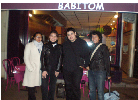
A 6 on s'est éclatés quand même!